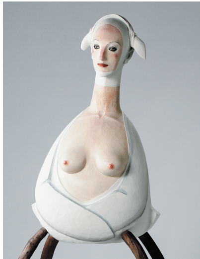
舟越 桂 《海にとどく手》(部分) 2016年