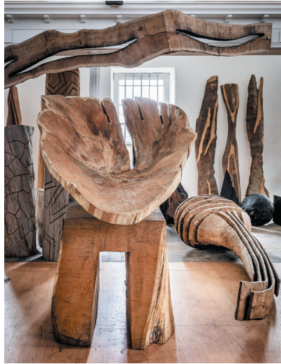
David Nash 《Bowl》 1994年

第11回円空大賞展では、岐阜県羽島市の円空仏7体と受賞者の作品が響き合う会場構成を試みます。円空の生き方、願ったもの、そして、受賞者が継承し創造したものが美しく共鳴する本展に是非ご期待ください。