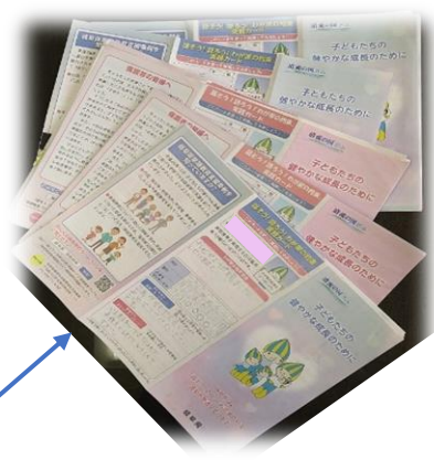
各家庭から提出された約束運動のリーフレット

「大きな声で挨拶をする」「家族そろって過ごす時間を作る」という約束に取り組むことがきっかけとなり、お互いに1日の出来事を話すなど、家族の会話が増えています。会話の楽しさを実感し、今後も続けていこうという気持ちをもつことができました。また、いつも大きな声で挨拶をする母親の姿にあこがれをもち、まねをしたいと考える親子関係も素敵です。