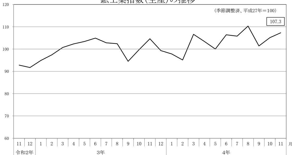
鉱工業指数(生産)の推移

季節調整済指数・・・季節的、社会制度による1年を周期として繰り返される変動を取り除いて指数化したもの 原指数・・・調査によって得られた数値をそのまま指数化したもの