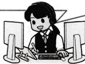
【警察本部 通信指令課】

110番通報すると、通信指令課の警察官が左のような質問をするので、落ち着いて教えてくださいね