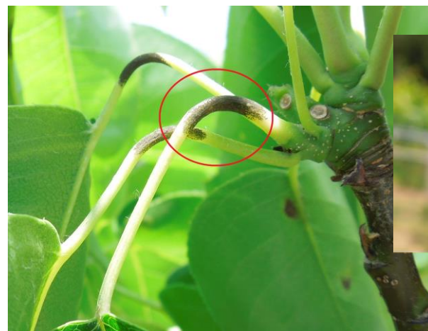
葉柄部に形成された孢子

また、果実肥大に影響のない程度に罹病部位を除去し、ほ場内の菌密度を下げてください。