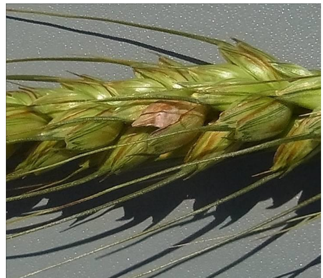
小麦に発生した赤かび病(乳熟期頃から発生が見られます)

ほ場における防除適期は開花始期～開花期(出穂期7～10日後)とその10日後です。赤かび病の防除は適期を逃さないことが重要です。麦の生育状況をよく確認してから行いましょう。