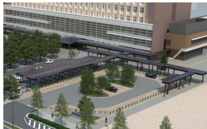
車寄せ・駐車場と庇のイメージ