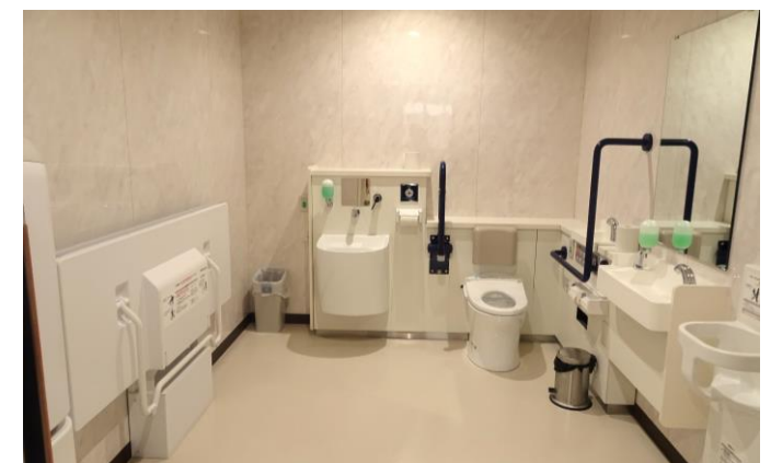
多目的トイレのイメージ