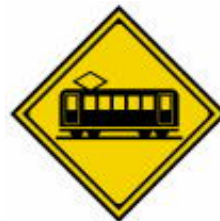
Cruzamento com Linha Férrea