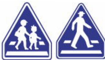
Faixas de Pedestres