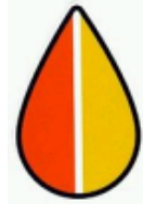
Selo Motorista Idoso