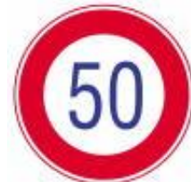
Velocidade Máxima Permitida