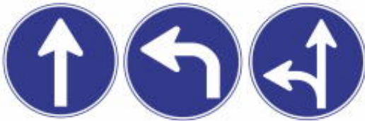
Siga Somente nas Direções Designadas