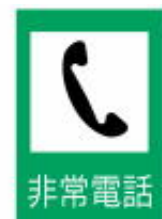
Telefone de Emergência