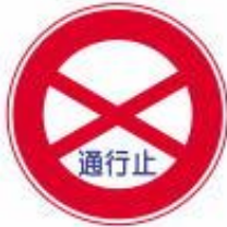
Estrada Fechada ou Proibido Entrar