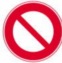
Fechado para Todos os Veículos