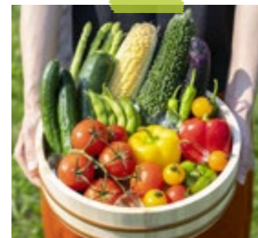
地元の食べ物や商品を選ぶ