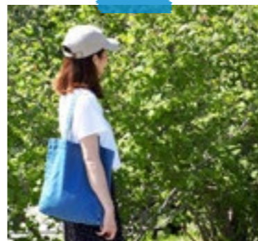
エコバッグを持ち歩く