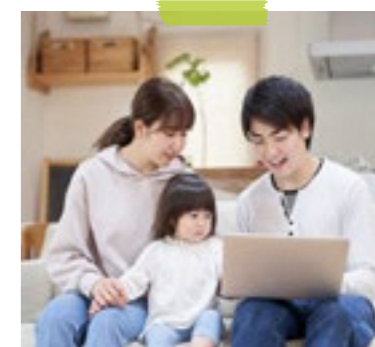
一つの部屋で過ごす