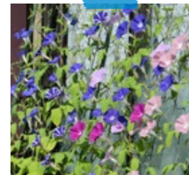
グリーンカーテン作り