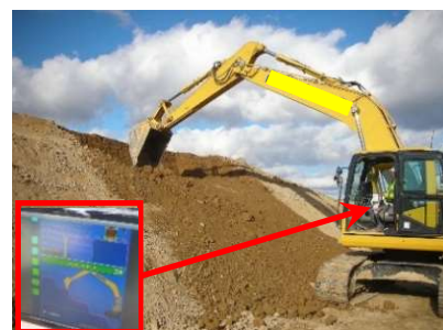
ICTを活用した施工例