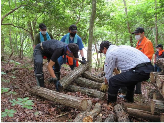
しいたけの原木移動

森林整備の継続により森林内は明るくなり、社員や地域の憩いの場としても活用できるようになりました。また、親子で参加する木工体験も取り入れ、活動の幅を広げています。