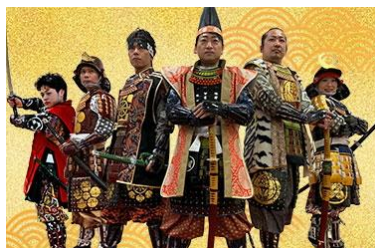
刈谷城盛り上げ隊