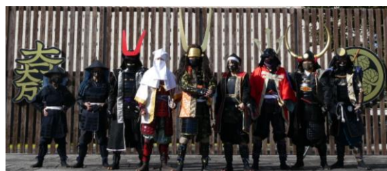
古戦場おもてなし武将隊関ヶ原組

今回、水野勝成 みずのかつなり の居城・刈谷城を拠点に活動する「刈谷城盛り上げ隊」、宇喜多秀家 うきたひでいえ の居城・岡山城を拠点に活動する「岡山戦国武将隊」を迎え、関ヶ原を拠点に活動する「古戦場おもてなし武将隊関ヶ原組」との交流演武を行います。