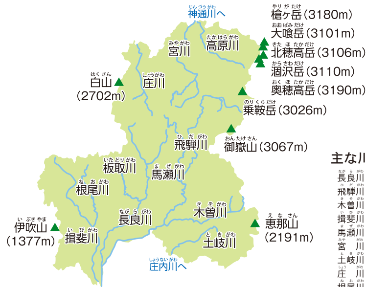
※図中の河川や山岳の表示は、概ねの位置関係である。

飛騨地方には、標高3000m級の山々がそびえ、美濃地方には、海抜0mの水郷地帯があるね。