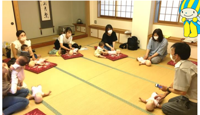
ダミー人形で乳児の心肺蘇生を学ぶ中野方乳幼児学級の参加者たち

7月13日、明智乳幼児学級では、恵那中央出張所えなえーる**から講師を招いて発酵食品について学びました。講師の指導を受けながら、実際にしょうゆ麴を作ったり、しょうゆ麴でえのき茸を煮てなめたけを作ったりしました。普段、子育てに手がかかる時期でもあるので、手のかかる料理は敬遠がちで、発酵食品なんてなおさらという感じのお母さんたちですが、発酵食品の大切さを聞いて、発酵食品を自分の手でとても簡単に作れることにびっくり。たいへん有意義な学びの機会になったようです。