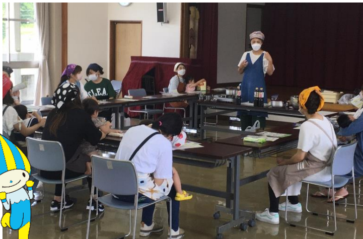
講師から発酵食品の大切さについて学ぶ明智乳幼児学級の参加者たち

この学級には、地域の読書サークルのメンバーが応援に来てくれています。学級の最初に行われる絵本の読み聞かせは、子ども達が落ち着いてス