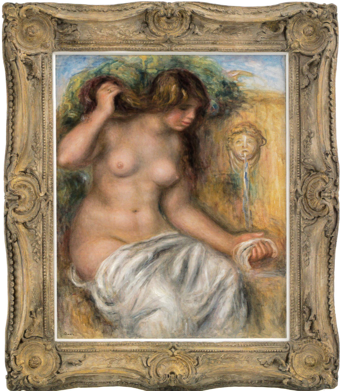
ピエール・オーギュスト・ルノワール《泉》1910年頃 岐阜県美術館蔵

第1部 2022年7月30日(土) - 10月2日(日) 第2部 2022年10月4日(火) - 12月25日(日) 第3部 2023年1月5日(木) - 3月19日(日)