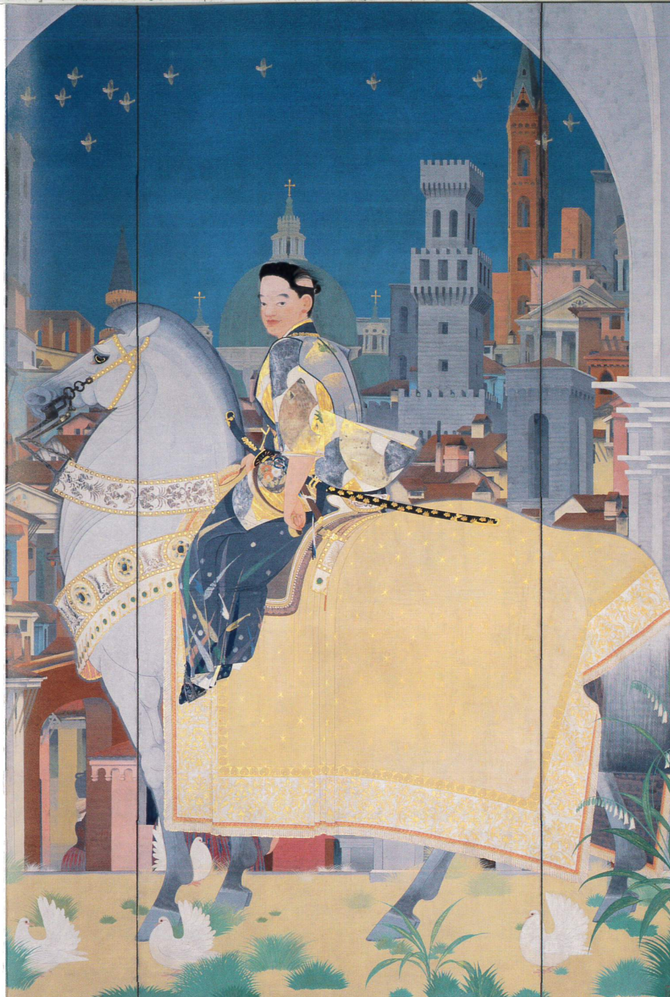
《羅馬使節》1927年 早稲田大学 會津八一記念博物館蔵 ©Y. MAEDA & JASPAR, Tokyo, 2022 E4701