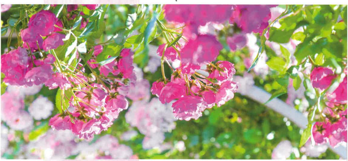
世界に誇る、バラと花々の大庭園