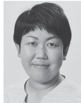
いわぶち 友 1976年生まれ。 参議院議員1期、 党中央委員