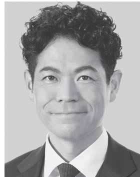
たけだ 良介 1979年生まれ。 参議院議員1期、 党中央委員