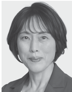
田村 智子 1965年生まれ。 党副委員長・ 政策委員長、 参議院議員2期