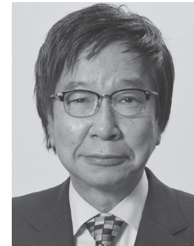
大門 みきし 1956年生まれ。 参議院議員4期、 党中央委員