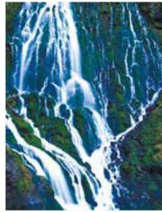
乗鞍山麓五色ヶ原の森 (高山市)