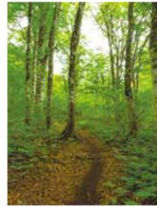
天生県立自然公園と 三湿原回廊 (飛騨市、白川村)