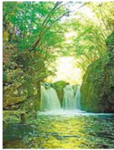
小坂の滝めぐり (下呂市小坂町)