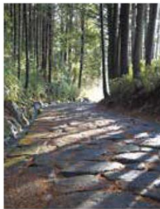
中山道ぎふ17宿 (中津川市～関ヶ原町)