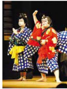
東濃地方の地歌舞伎と 芝居小屋 (恵那市・中津川市・瑞浪市)