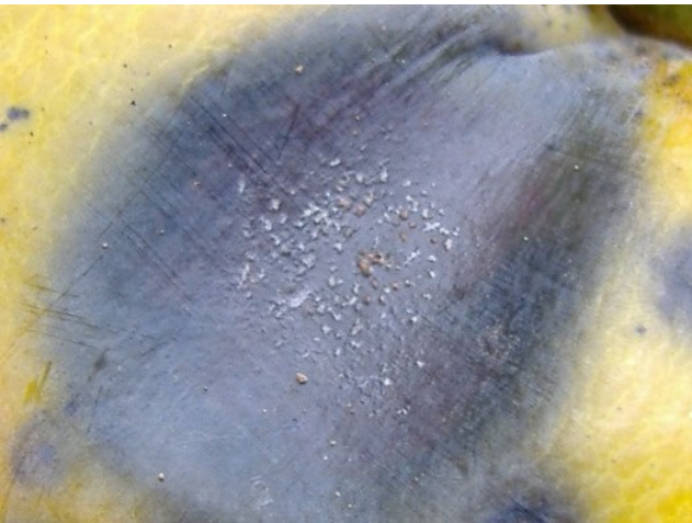
図3 果実病斑上の孢子塊