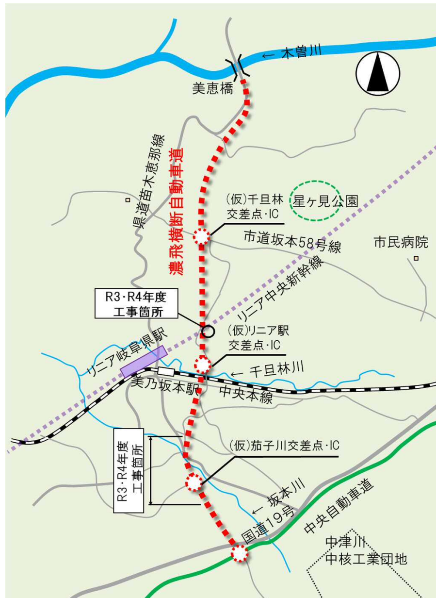
工事期間を長く必要とする区間（駅南地区）を先行して事業を進めています。