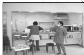
地元ボランティアによる開所前の清掃