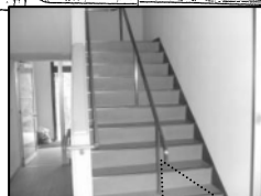
新たに設置した階段手摺り