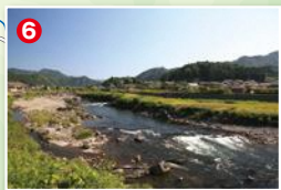
ドオクの瀬の下流部。瀬の間に2段のタナがあってアユが溜まる