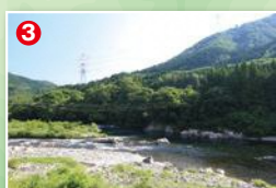
「みやちか」上流は中州で流れが分かれる。右岸筋はヤナ場になり左岸筋の瀬が本命釣り場