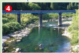
勝原(かっぱら)橋より下流を見る。鉄橋下の瀬が本命釣り場