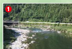
白石橋の下流の瀬は終盤が面白い