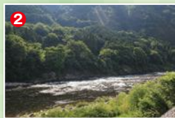
「みやちか」下流の荒瀬は岩盤底で大型が残る