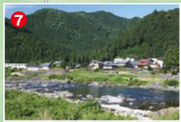
ドオクの瀬の上流部を左岸入川口から見る。いかにも大アユが残りそうな大岩と岩盤が織り成す