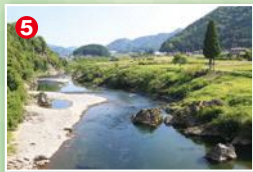
勝原橋上流の淵がラフティングの終着点。ここを釣るならラフティングの来ない午前である