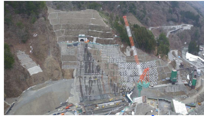
③ ダムサイト左岸状況(右岸上空より望む)