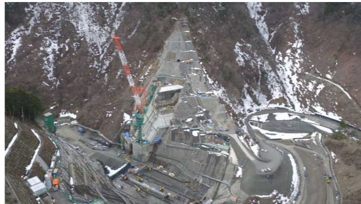
② ダムサイト右岸状況(左岸上空より望む)