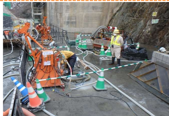
グラウチング施工状況