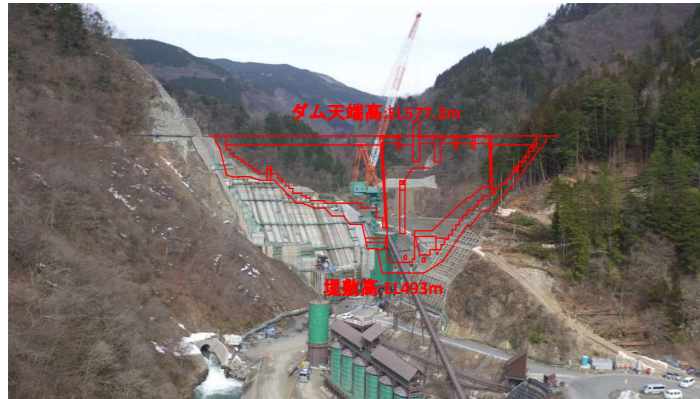
① ダムサイト状況(下流上空より望む)