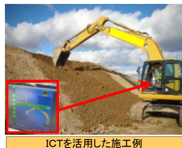
ICTを活用した施工例