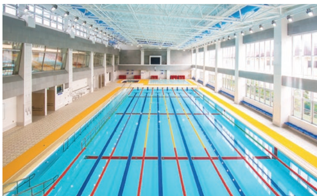
岐阜県福祉友愛プール