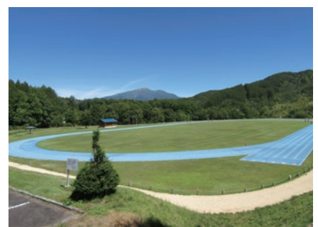
飛騨御嶽高原高地トレーニングエリア