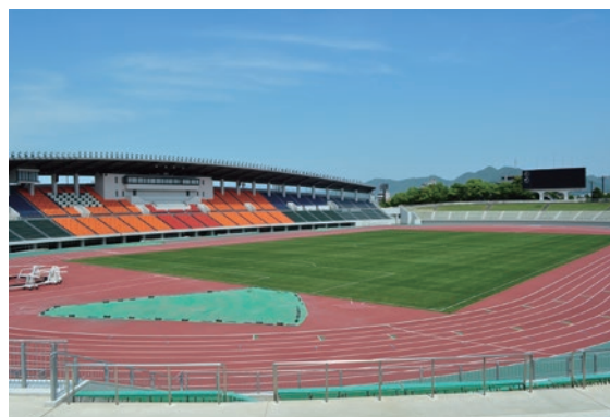
岐阜メモリアルセンター(長良川競技場)