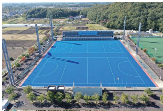
岐阜県グリーンスタジアム