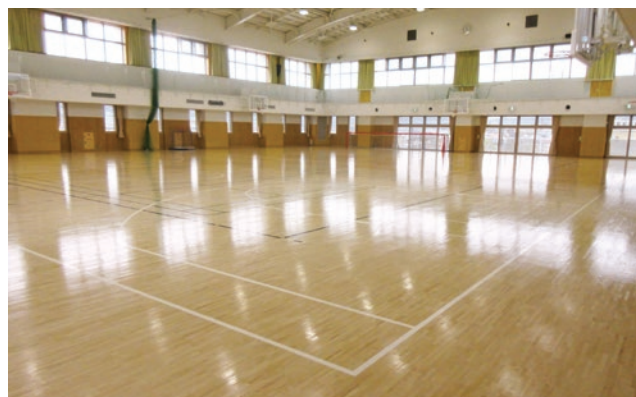
岐阜県福祉友愛アリーナ