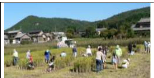
R3 御嵩公民館 田んぼの学校の様子