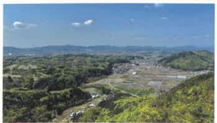
みのかも健康の森の名物「777段の階段」を登った先にある「よるこびの岩」から見渡すことができる里山風景。

2030年のゴール「ローカルSDGsみのかも」を目指し、「心」「体」「社会」における「健康のまち」の実現に向け、「里山」と「STEAM」をベースに、市内のステークホルダーとプラットフォームを設立し、新たな価値を生み出すイノベーションの創出とリ・デザインを行う。