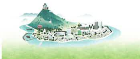
金華山や長良川をはじめとする山水の自然と柳ヶ瀬商店街など市街地の都市の資源に恵まれた岐阜市のまちなみ。

SDGsに向けた取組みにおいて、多くの人を巻き込む様々な仕掛けを施しながら、市民の誰もがシビックプライドとWell-beingを感じ、まちを好きになり、持続可能なまちづくりに関わっていく、そんな好循環が生まれるまちを目指す。