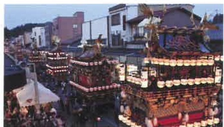
飛騨の匠の技や伝統文化を伝える高山祭。屋台は国の重要有形民俗文化財に指定され、屋台行事はユネスコ無形文化遺産に登録されています。

飛騨高山特有の風土と、先人が生み出し、守り、築き上げてきた自然、歴史・伝統が後世に引き継がれるとともに、それらを活かした地域経済の発展が図られ、心豊かな暮らしが営まれる、国内外から選ばれ続ける「国際観光都市」の実現を目指す。