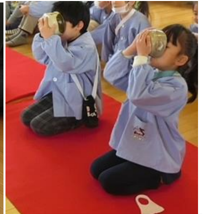
お茶を飲み切る作法も学びました。

「お茶の会」は2年前まで行っていたもので、対象は園児全員でした。今年は何とか実施したいという願いで、年長さんに絞りました。講師の配慮で、お茶碗は一人1個ということで55個用意されました。お菓子やお茶をたてたり出す際にも、手袋を着用されています。