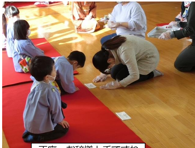
正座・お辞儀上手ですね