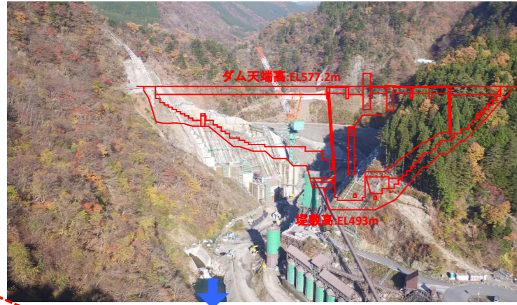
① ダムサイト状況(下流上空より望む)