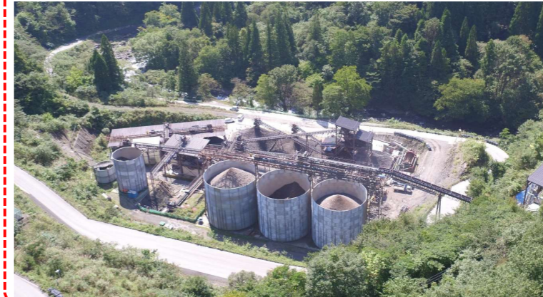
⑤ 骨材製造設備稼働状況