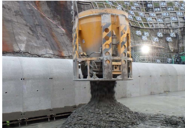
バケットによるコンクリート打設状況