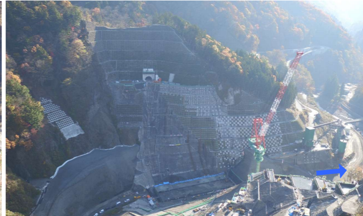
③ ダムサイト左岸状況(右岸上空より望む)