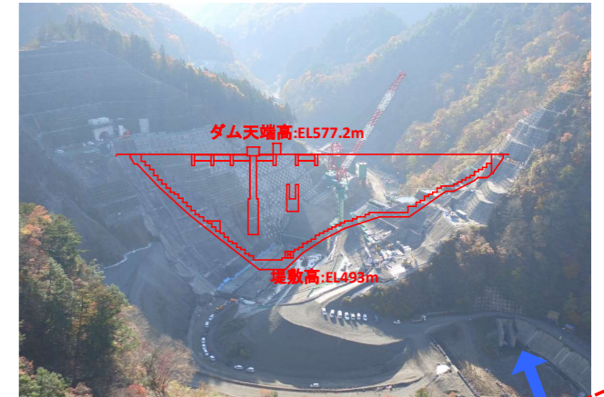
④ ダムサイト状況(上流上空より望む)