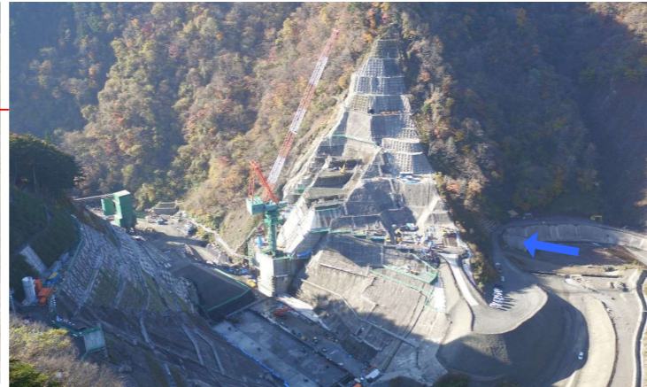
② ダムサイト右岸状況(左岸上空より望む)