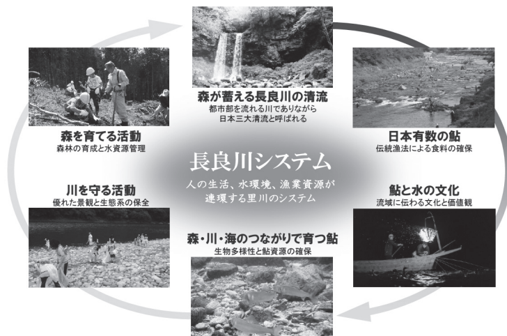
図2-4-3 長良川システム

今後、「清流長良川の鮎」を進化させながら、将来にわたり守り伝えるため、世界農業遺産「清流長良川の鮎」の世界農業遺産保全計画（アクションプラン）に基づく取組みを着実に進める。