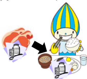
食品中への薬剤残留