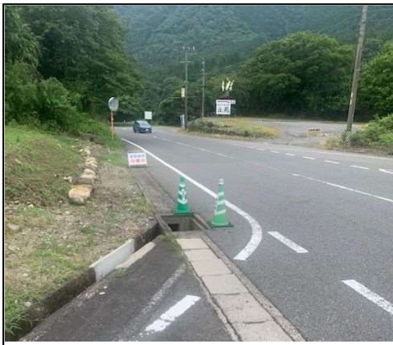
地点① (北側から南へ向かって撮影)