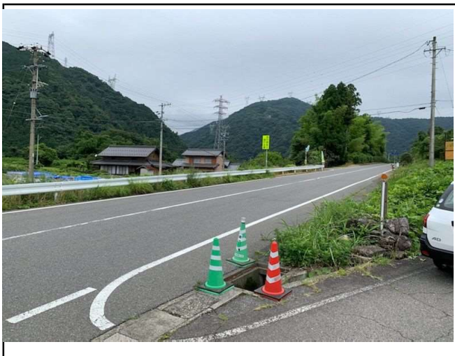
地点② (南側から北へ向かって撮影)