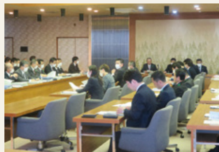
第1回対策委員会の様子