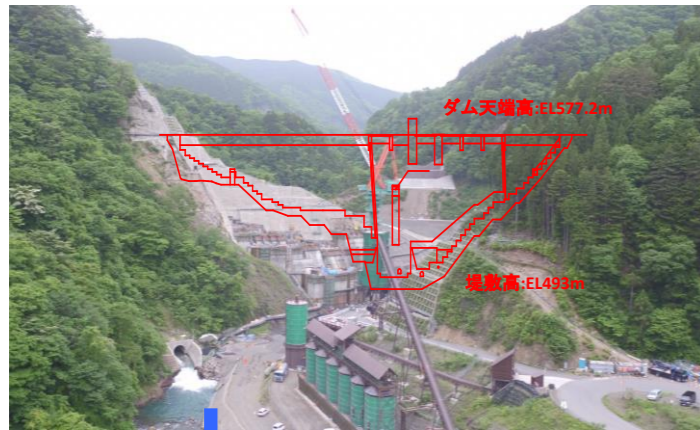
① ダムサイト状況(下流上空より望む)