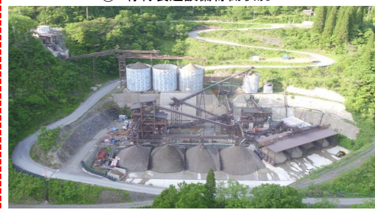
⑦ 骨材製造設備稼働状況