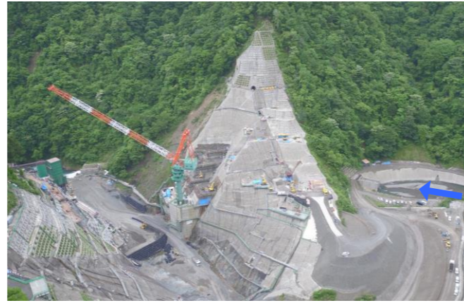
② ダムサイト右岸状況(左岸上空より望む)