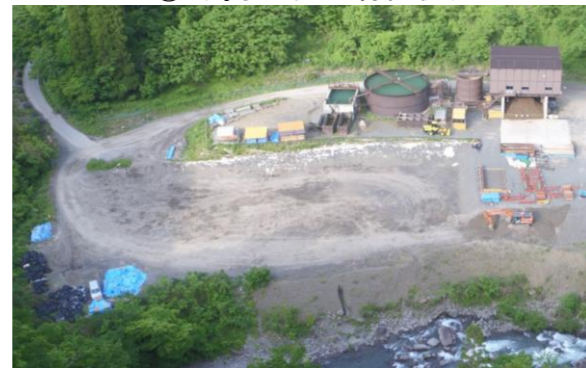
⑥ 濁水プラント稼働状況