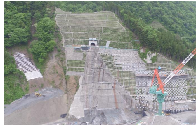
③ ダムサイト左岸状況(右岸上空より望む)