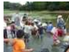
ため池の外来種駆除