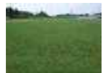
カバークロープ (緑肥) の作付け