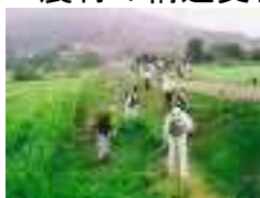
農地法面の草刈り