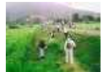
農地法面の草刈り