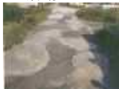
農道の窪みの補修