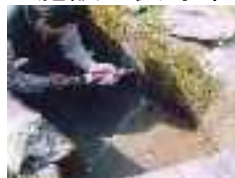
水路のひび割れ補修