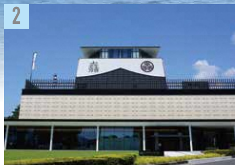
2 西濃・岐阜関ヶ原古戦場記念館