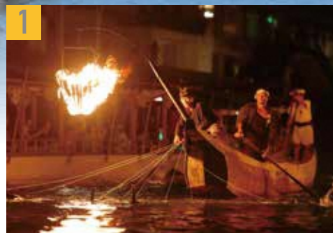
1 岐阜・長良川鶯飼