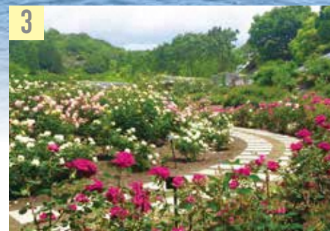
3 中濃・花フェスタ記念公園