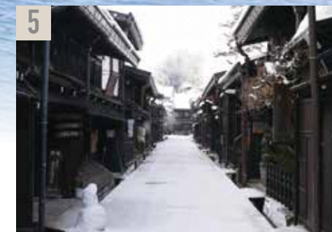
5 飛騨・高山古い町並