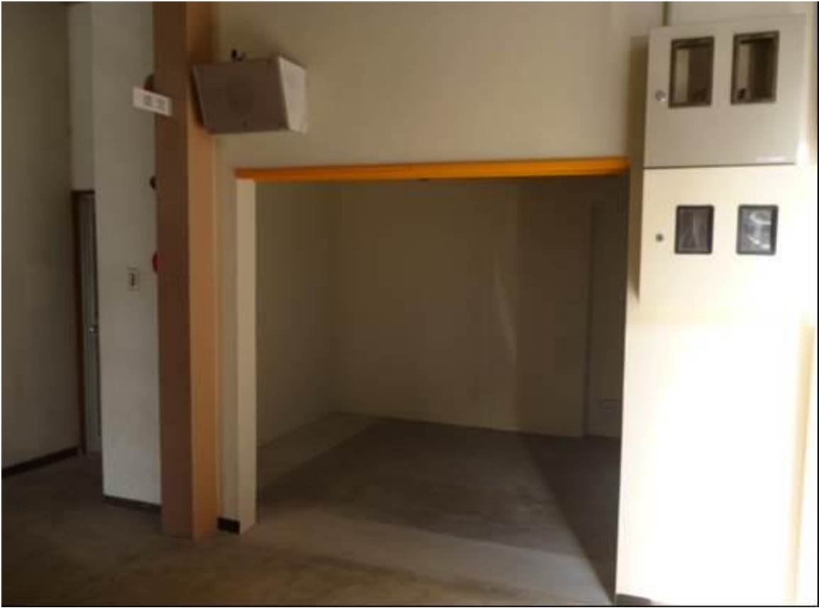
生徒昇降口側から自販機設置予定場所を望む 入り口部分の高さは約1.8m