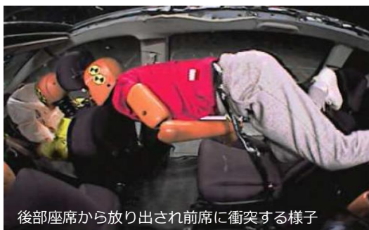
後部座席から放り出され前席に衝突する様子