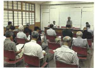
【法人設立に向けた説明会】

いて説明がされた後、参加者との質疑応答が行われました。一部の農家からは、今後の経営に若干不安視する声があがったものの設立反対の声は皆無であり、最終的には、拍手をもって設立が了承されました。