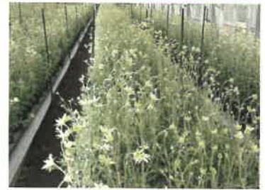
【収穫直前のハウス内】