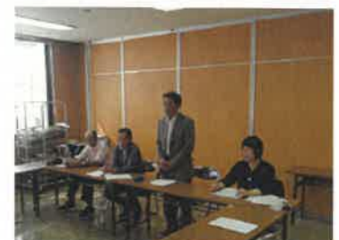
【学生を激励する指導農業士会長】

農業普及課は、今後一か月間の派遣学習中に個別巡回を行い、農業大学校生を支援していきます。