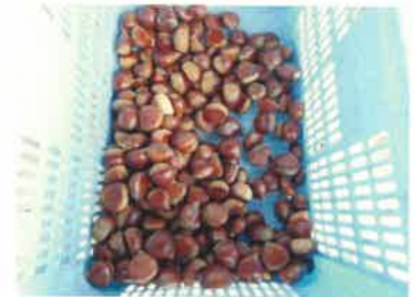
【JA八百津支店に初めて出荷された栗】