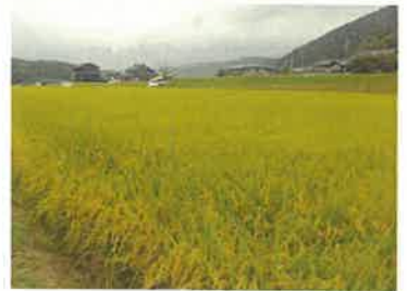
【成熟期の「あきあかり」】