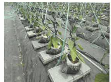
【3Sシステム定植後の状態】