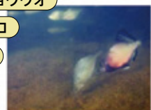
イタセンパラ(希少野生生物)