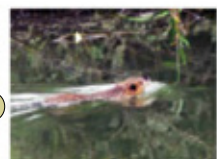
ヌートリア(外来生物)