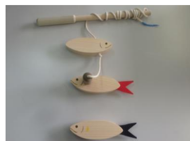
木のおもちゃ 鮎の友釣り