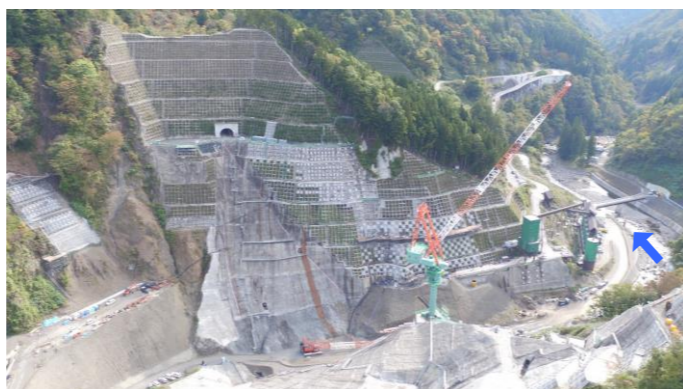
③ ダムサイト左岸状況(右岸上空より望む)