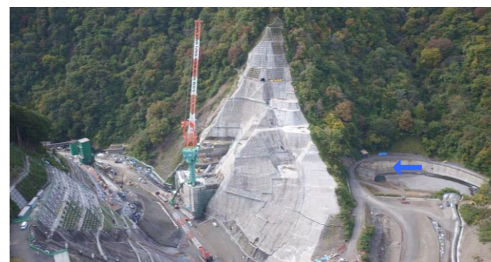
④ ダムサイト右岸状況(左岸上空より望む)