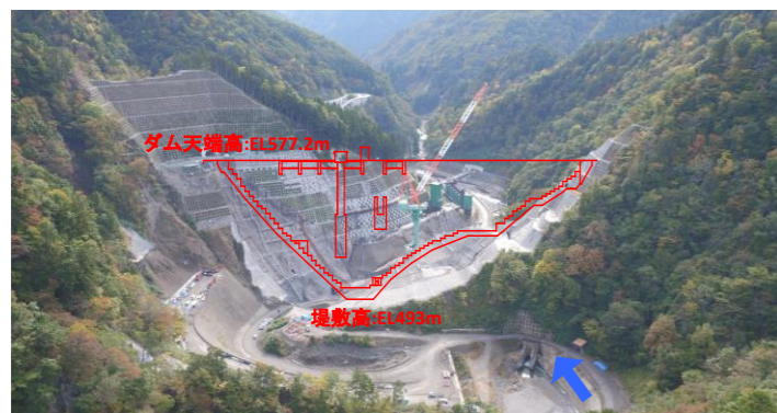
① ダムサイト状況(上流上空より望む)