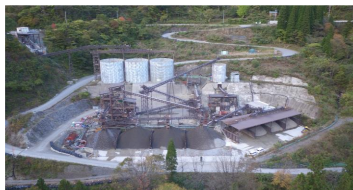
⑥ 骨材製造設備稼働状況