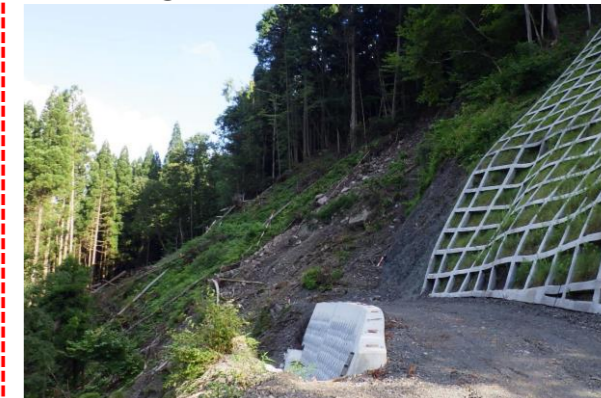
⑤ 下流工事用道路状況