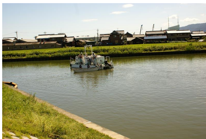
写真 4.2 水質対策船による攪拌(H24 実施)