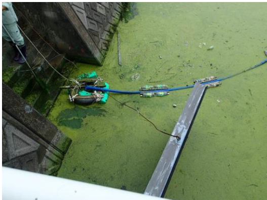
写真 4.3 水中ポンプによる水の汲み上げ(H28 実施)