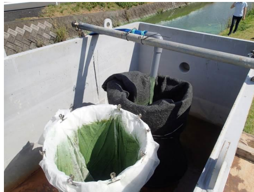
写真 4.4 フィルター材によるアオコの回収(H28 実施)