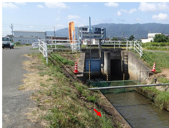
写真 4.6 水門の開放状況 (H28 実施)