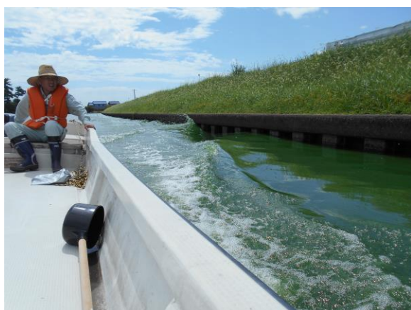
写真 4.1 モーターボートによる攪拌(H28 実施)

海津市所有の小型船(モーターボート)や、必要に応じて国土交通省中部地方整備局木曾川下流河川事務所所有の水質対策船を借用するなどして攪拌を行う。(H23, 24, 28 実施)