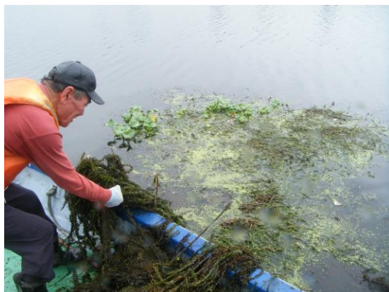
写真 4.5 ウキクサ回収状況 (H28 実施)