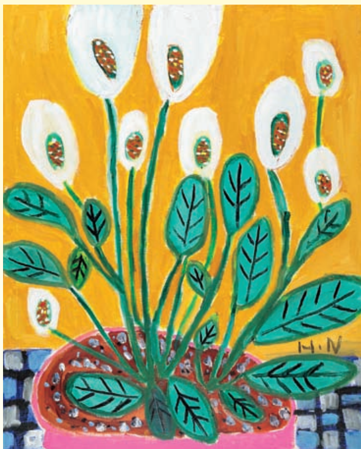
ふれあいアートステーション・ぎふ 令和元年度知事賞作品