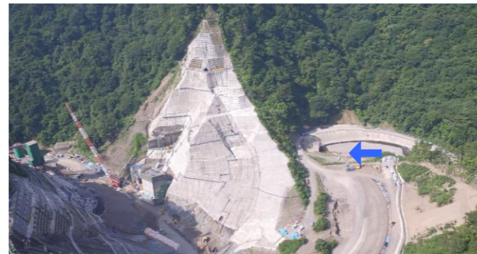
④ ダムサイト右岸状況(左岸上空より望む)