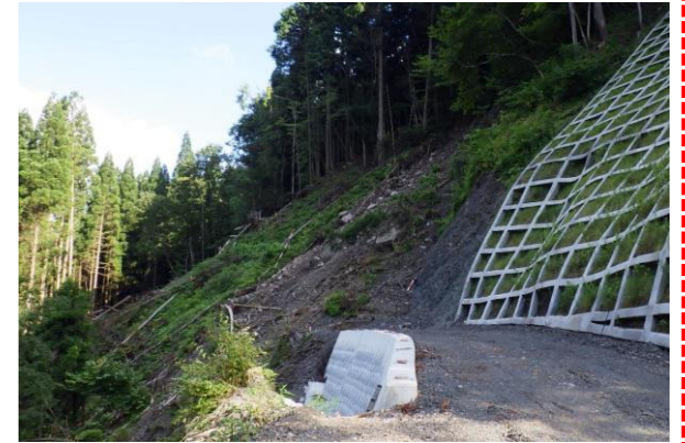
⑤ 下流工事用道路状況