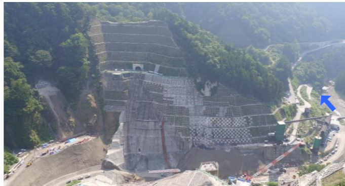
③ ダムサイト左岸状況(右岸上空より望む)