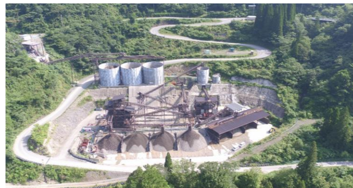
⑥ 骨材製造設備稼働状況