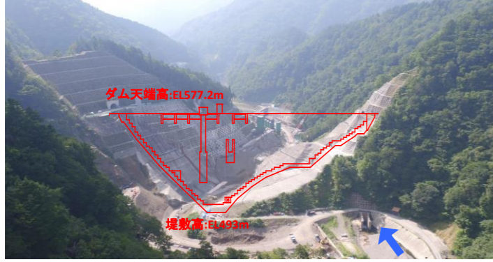
① ダムサイト状況(上流上空より望む)