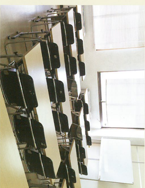
小会議室 (5南会議室)