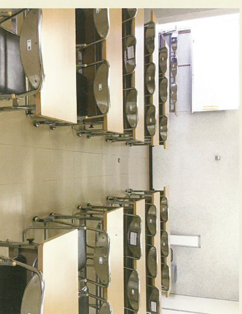
小会議室 (2南会議室)