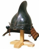
西军 织田秀信佩戴的银箔鸟帽子形头盔（圆德寺藏品、岐阜市历史博物馆保管） 4月22日(周六)～5月21日(周日)展示