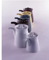
森正洋 白山陶器株式会社 《G型酱油壶》1958年（设计）