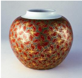
富本宪吉 《色绘金银四弁花模様饰壶》 1960年

从蕴藏作者艺术性的逸品到设计精美的量产工艺制品，现代陶艺美术馆汇集了国内外各流派的陶艺品。本展出上按制作年代展示了本馆引以为傲的所藏作品，参观者可以感受到同时代作品间意外的关联性以及陶艺作品丰富的表现力。