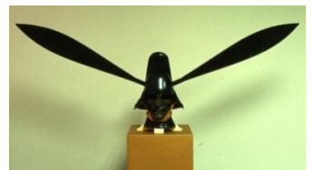
东军 藤堂高虎佩戴的唐冠形头盔（三重县指定有形文化遗产） 4月22日(周六)～6月25日(周日)展示