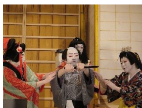
Iiji-Gomo-za Kabuki Preservation Society

Ang Kashimo Kabuki Preservation Society (Nakatsugawa-shi) at Houo-za Kabuki Preservation Society (Gero-shi), na nagtanghal sa Pransya at Espanya ngayong Oktubre, ay magkakaroon ng isang matagumpay na pagbabalik sa Gifu kasama ng Kushihara at Iiji-Gomo-za Kabuki Preservation Society (parehong mula sa Ena-shi).