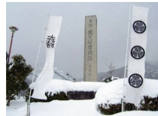
Lumang lugar ng Digmaan sa Sekigahara (winter/tag lamig)

Magsasagawa ng photo contest upang maipalaganap sa buong bansa ang appeal ng Sekigahara, ang lupain ng makasaysayang labanan sa Japan.