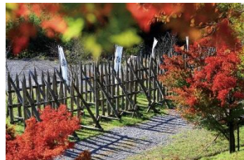
Lumang lugar ng Digmaan sa Sekigahara (autumn/taglagas)