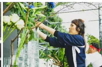
Competição de Ikebana

Será realizado um evento com a temática da Batalha de Sekigahara e o confronto leste oeste. Haverá show no palco reproduzindo a Batalha de Sekigahara; “Competição de Ikebana” na qual os praticantes arranjam as flores de forma improvisada e disputam as belezas; e competição leste-oeste dos restaurantes famosos de macarrão localizados na região leste e oeste do Japão.