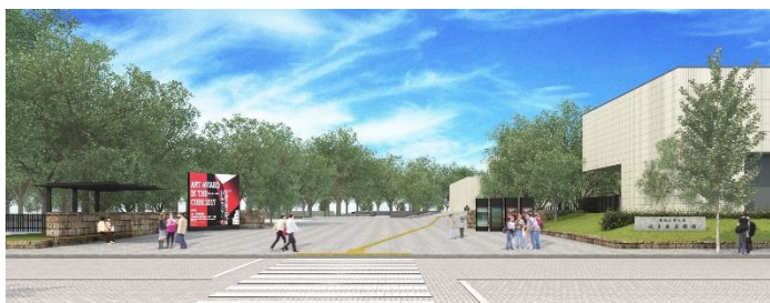
Portal de entrada sul reformada (ilustração)

O Museu de Belas Artes de Gifu renascerá como um “Museu acessível” para que todos possam utilizá-lo de forma confortável através da implantação de estacionamentos acessíveis e sala de apoio à amamentação. No dia da reabertura será realizado um evento comemorativo e o “Festival de outono Seiryu no Kuni Gifu Bunka no Mori ” na rua (fechada exclusivamente para o evento) localizada entre o Museu e a Biblioteca da Província de Gifu.