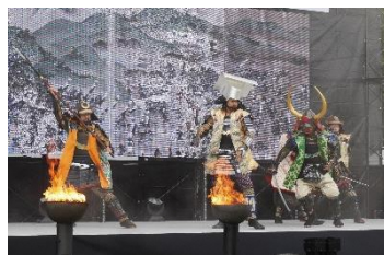
Show no palco reproduz a Batalha de Sekigahara