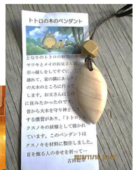
トロの木のペンダント